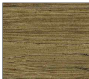
20 Sosnowa kora