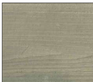
19 Oliwka bielona