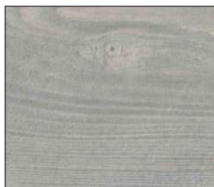
03 Jesion bielony