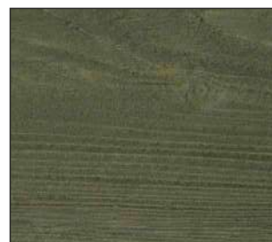
21 Hiszpańska oliwka