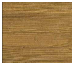
07 Dąb węgierski