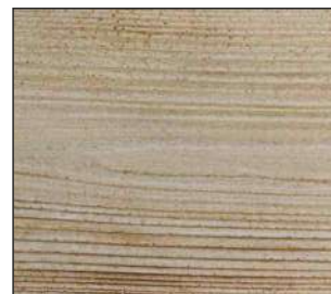
30 Sosna skandynawska