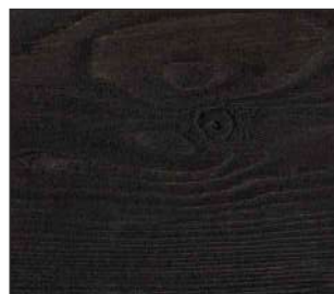
24 Wenge kongo