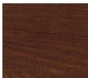
16 Cedr kanadyjski