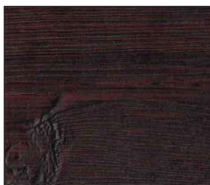
18 Ciemny machoń