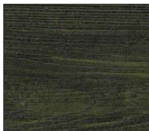
23 czarna olcha