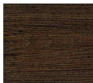
17 Orzech porto