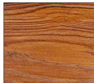
25 Dąb złoty