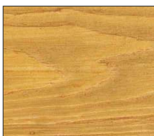
13 Sosna góraska