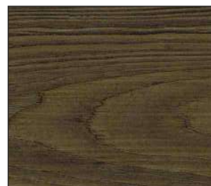
12 Śliwa łącka