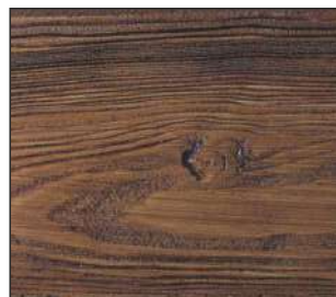
29 Ciemny orzech